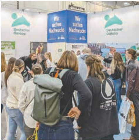
Mr. Ed sorgte für Aufmerksamkeit, wie hier am Sonntag